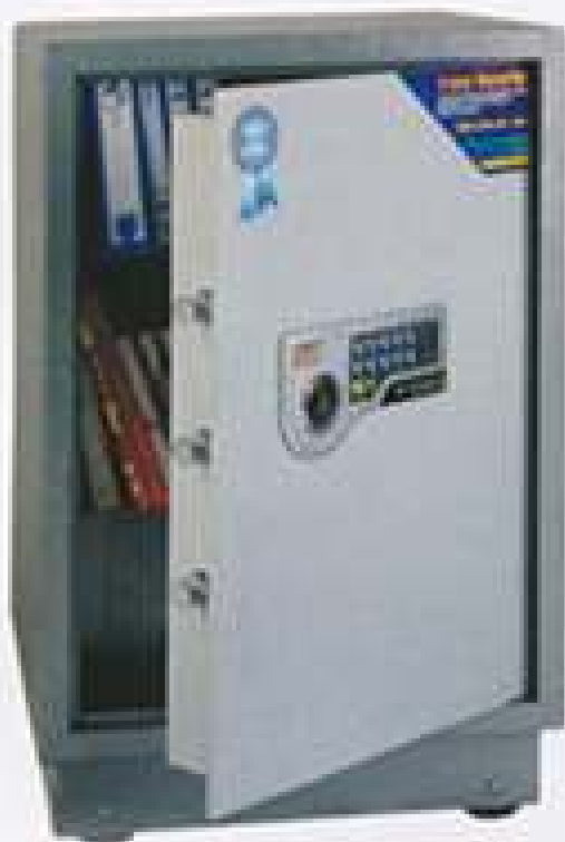
SJB-72III(B) H640xW420xD400mm 1 shelf 67KG