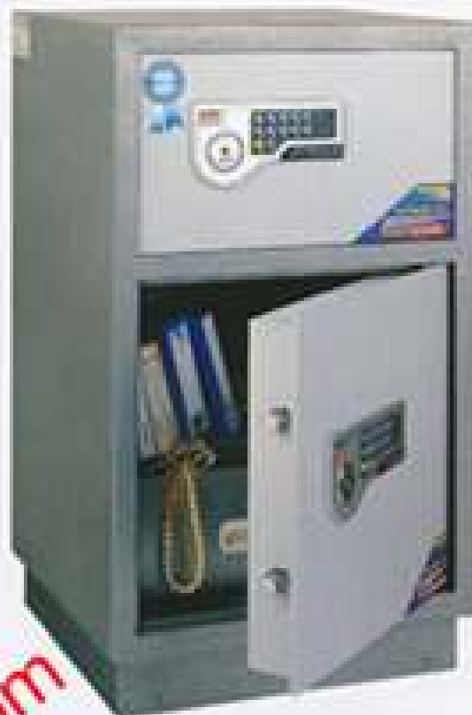
SJB-88III(BD) H765xW450xD400mm 1 shelf 94KG