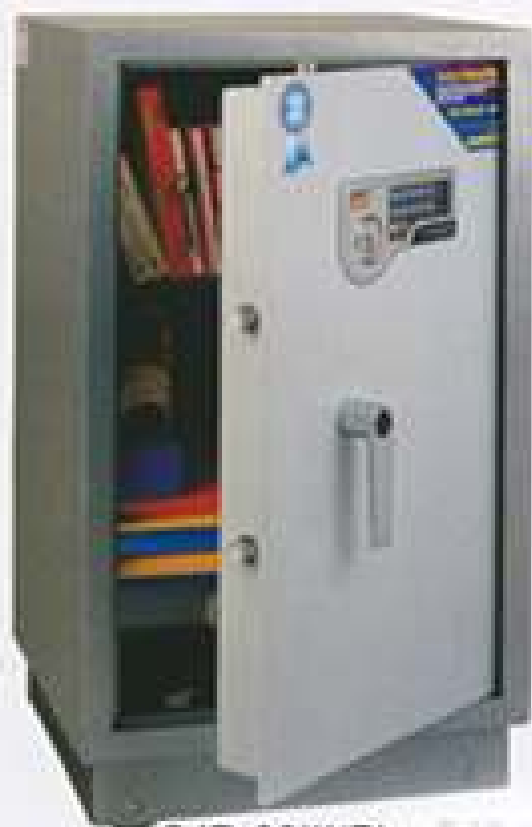
SJB-88III(B) H765xW450xD400mm 1 shelf 89KG