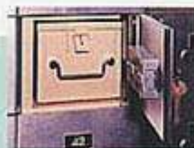
Safety box 內箱