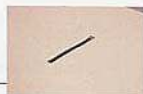
信封口 Letter hole