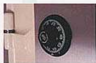
密碼鎖 Combination lock