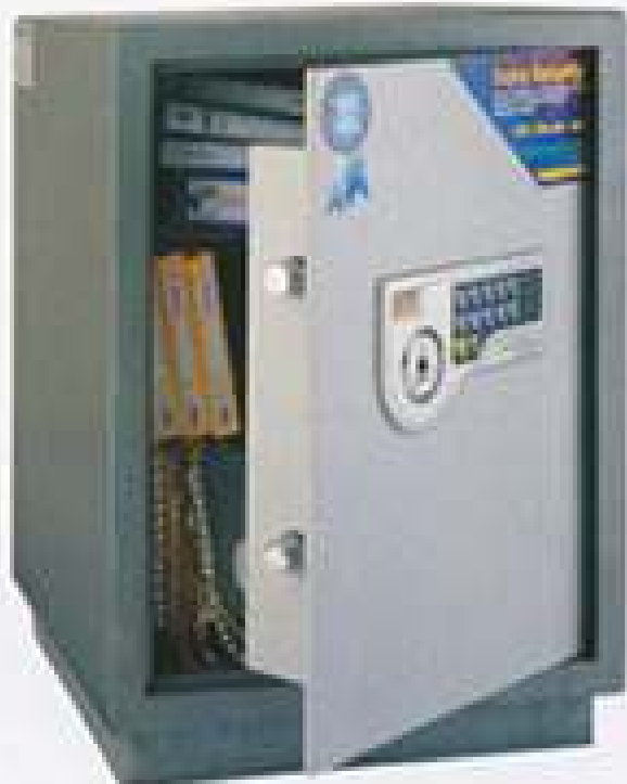
SJB-58III(B) H490xW360xD360mm 1 shelf 45KG